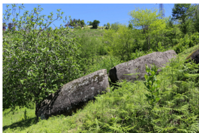
სურ. 1-3. სოფ. ზენითის სანნახელი