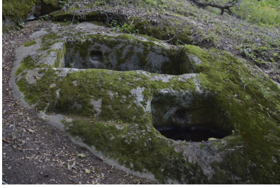
სურ. 6. სოფ. ზუნდაგას სანნახელი