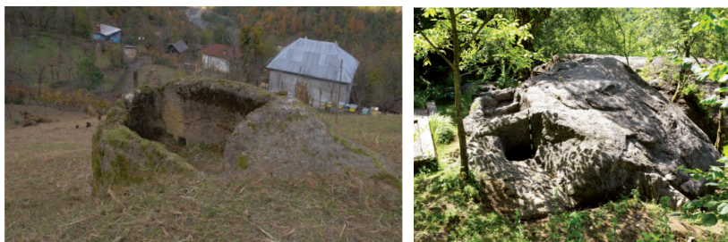
სურ. 4. სოფ. ოქტომბრის სანნახელი სურ. 5. სოფ. კორომხეთის სანნახელი