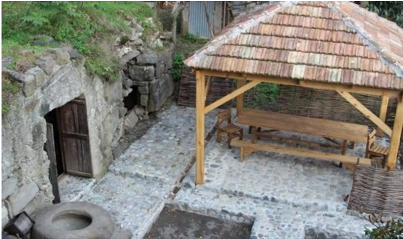
სურ. 12. სოფ. ჩიქუნეთი. ა. მაღაყმადის მარანი