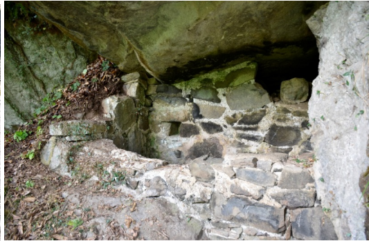
სურ. 9. სოფ. მერეს სანნახელი