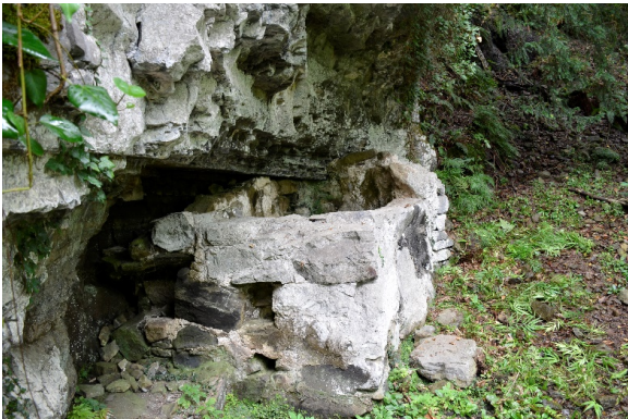
სურ. 10. ჭონჭყოს (ნაგერვაძეების) სანნახელი