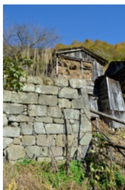
სურ. 16. სოფ. პირპილეთი. ა. ქოქოლადის მარანი