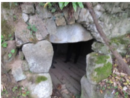
სურ. 15. სოფ. ჩხუტუნეთი. ძნელაძეების მარანი