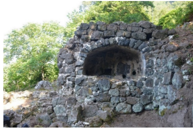
სურ. 7. შუშანეთის სანნახელი