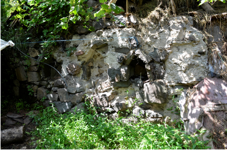
სურ. 11. სოფ. ცხემლარა. ზ. საღვარძის მარანი