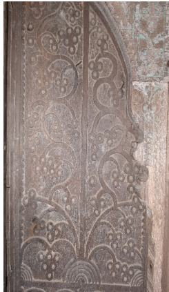
გულების ჯამე. ფრაგმენტი ვაზის გამოსახულებით.