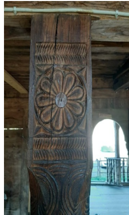
კვირიკეს ჯამე. ბოძის მორთულობა.