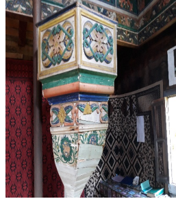
ჯაზნიძეების ჯამე. ქურსი.