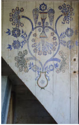
დღვანის ჯამე. ვაზის გამოსახულება