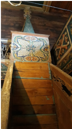
ჯაბნიძეების ჯამე. მინბარი.