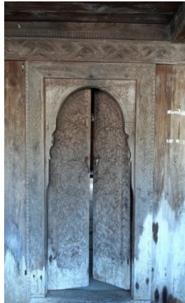
კვირიკეს ჯამე. შესასვლელი კარი.