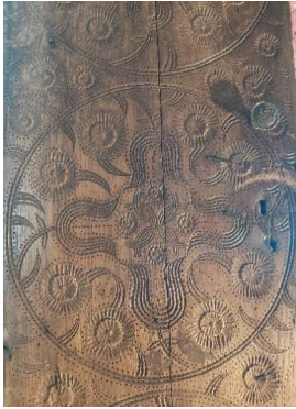
ქიძინიძეების ჯამე. შესასვლელი კარის ფრაგმენტი.