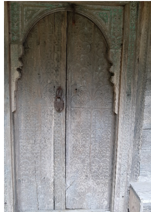
გულების ჯამე. შესასვლელი კარი.