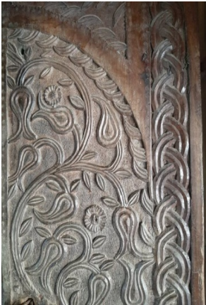
კვირიკეს ჯამე. კარის დეტალი.