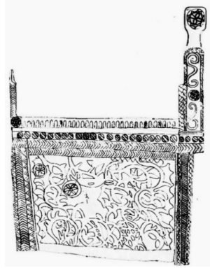
ქიძინიძეების ჯამე. ქურსი