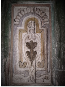
ნენის ჯამე. კარის ფრაგმენტი